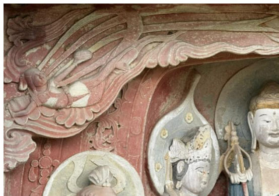
水宁寺 1 号窟飞天

“巴蜀飞天”IP：以水宁寺龕第 1 龕、南龕第 116 龕的“巴蜀式飞天”为核心，提取“俯身摘云”姿态、“短衫长裙”服饰、“竹枝/莲花”手持物三大元素，IP 形象定位为“灵动、亲切的巴蜀文化使者”，设计 Q 版、写实两种风格，适用于不同年龄段受众。