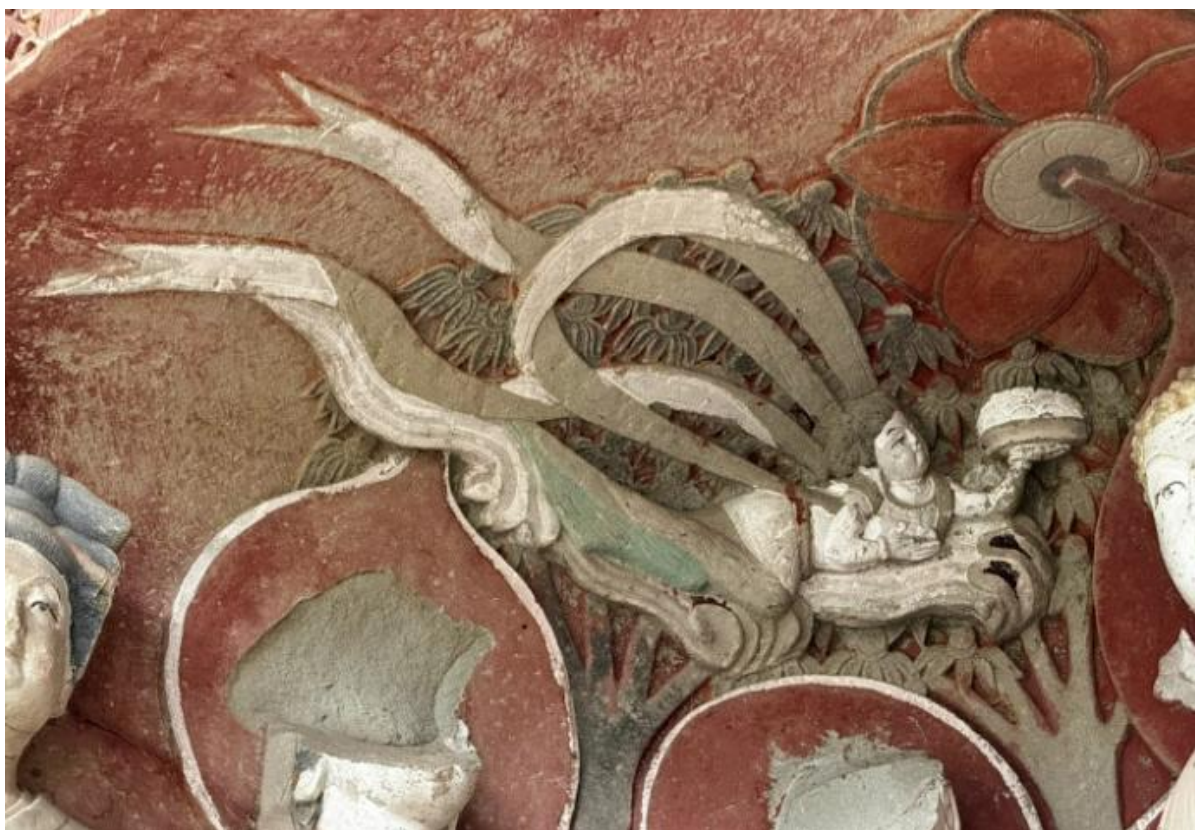
水宁寺 2 号窟顶飞天