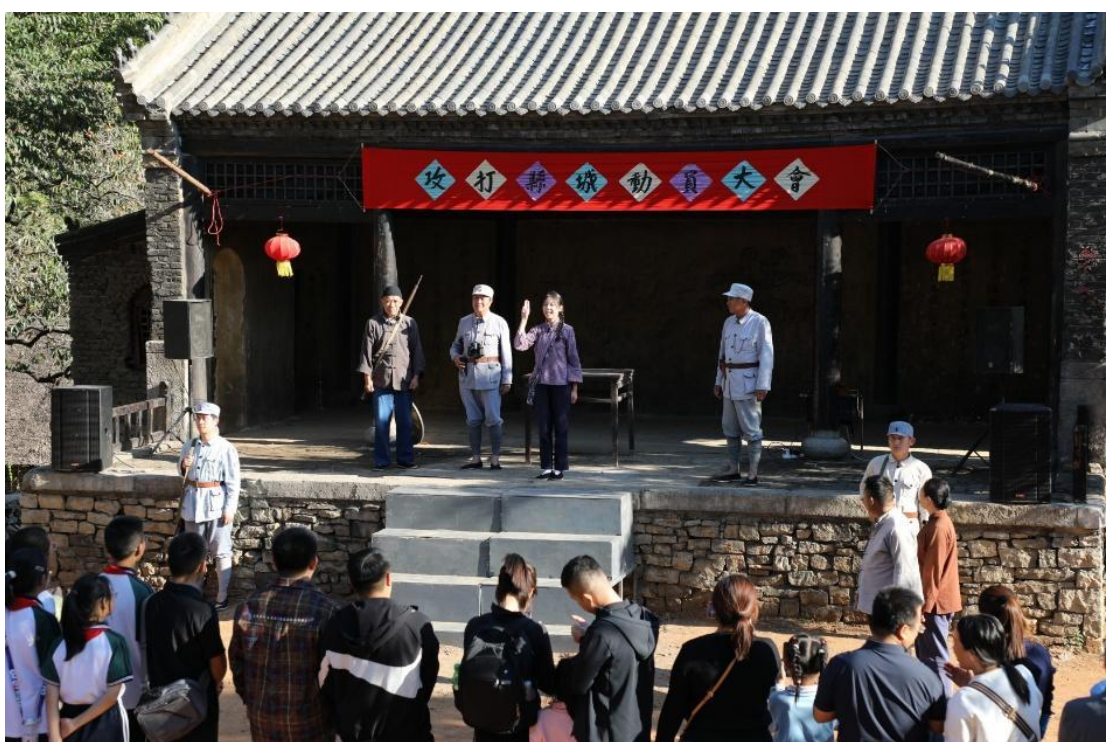
红色景区大型剧本杀活动体验现场（示例）