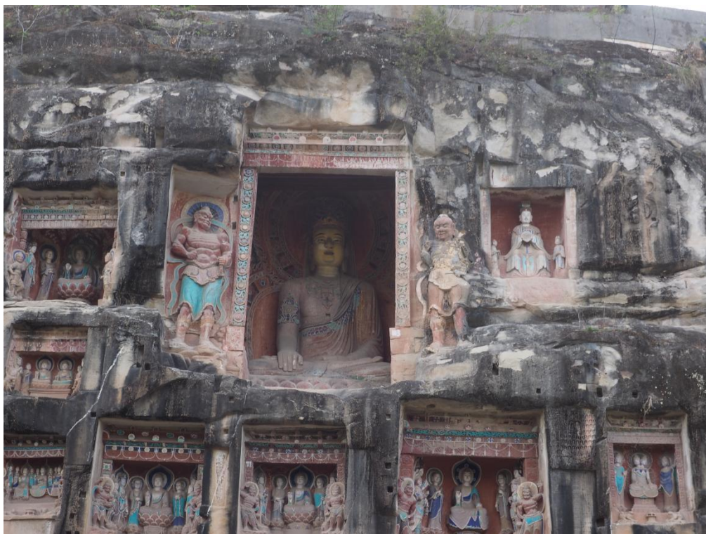
南龕 103 号毗卢舍那佛

高浮雕的主体表现：用于塑造佛、菩萨等主体形象，突出体积感和神圣感。南龕 103 号毗卢舍那佛龕，主佛通高 4.45 米，采用近乎圆雕的高浮雕技法，衣褶层次分明，立体感极强，从侧面观赏仍能感受其庄严气势。