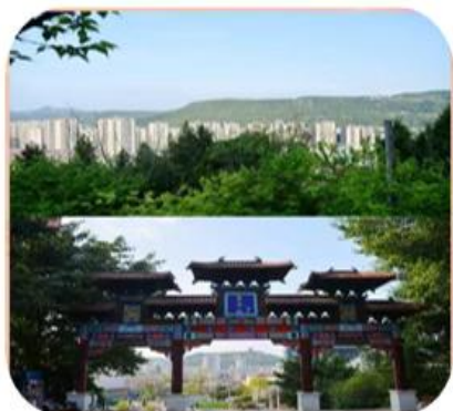
望王山——城市的“绿色客厅”

望王山是巴中城区的“绿色客厅”，植被丰富，空气清新。周末和家人爬山时，站在山顶可俯瞰整个巴中城区，城市的建筑、街道尽收眼底，让人心旷神怡。