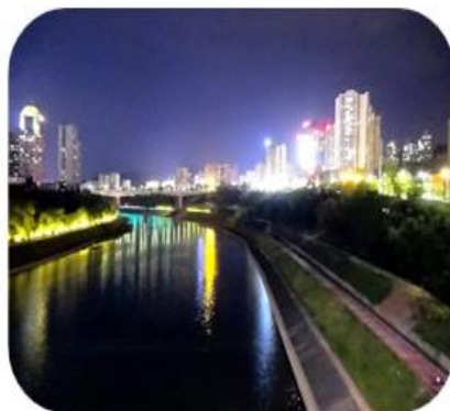
巴河夜景——流动的银河

望王山是巴中城区的“绿色客厅”，植被丰富，空气清新。周末和家人爬山时，站在山顶可俯瞰整个巴中城区，城市的建筑、街道尽收眼底，让人心旷神怡。