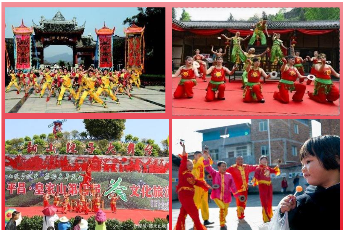
图 5：翻山饺子地域文化象征