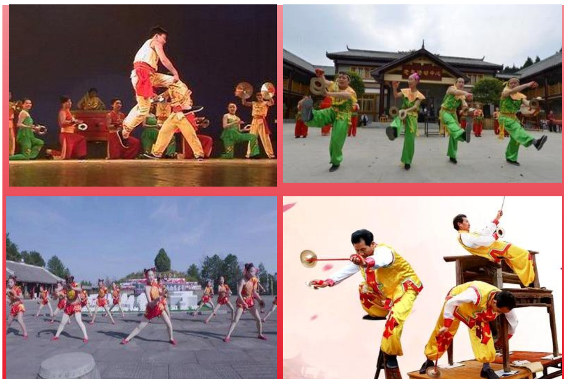
图 2：翻山饺子动作特点

合，起到了烘托气氛、强化舞蹈表现力的作用。此外，还有诸如踢腿、跺脚等步伐动作与之相呼应，使整个舞蹈动静结合、张弛有度。