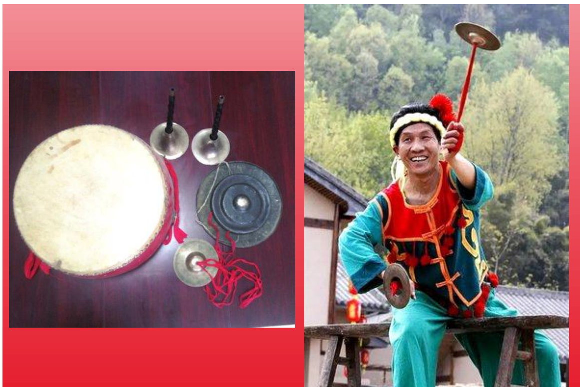
图 3：翻山饺子乐器搭配

相济，显示出张弛和跌宕，不但没有单调平直的感觉，反而别有一番情趣。在选择音乐时，需要考虑舞蹈的风格和情感表达，以确保音乐与舞蹈的完美结合。音乐与舞蹈动作高度契合，舞者依据锣鼓节奏来展现相应的舞蹈动作，二者相辅相成，共同构成了翻山饺子独特的艺术魅力。