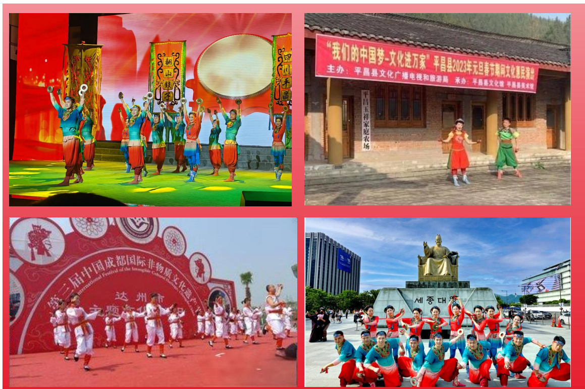
图 4：翻山饺子民俗文化体现