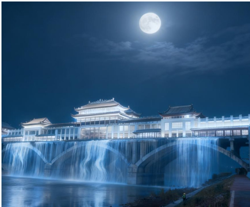
图 2 巴河廊桥夜景效 果图